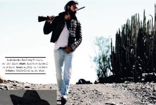
Jakel: Jack, Einhorn, T. 2000, in: 220 Euro, Shirt: Alcedo, in: 2000, in: 15 Euro, Jeans: 0360, in: 120 Euro, Schuhe: Timberland, in: 100 Euro