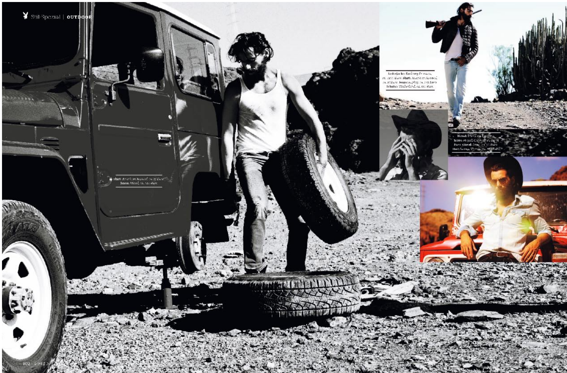
Shirt: Anakin, Alcedo, in: 2.000 Hose: 0360, in: 120 Euro