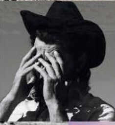
Hemd: 1.000, in: 100 Euro, Jeans: 0360, in: 120 Euro, Hose: 0360, in: 120 Euro, Hut: 0360, in: 120 Euro